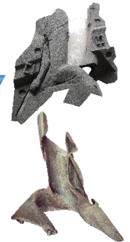
工艺品设计 砂型和成品