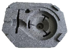
水泵砂型下盖和砂芯